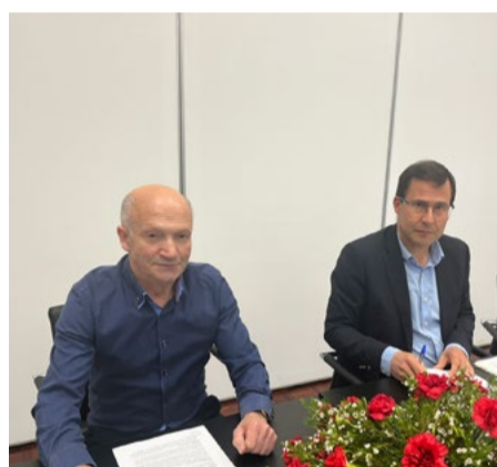
Freguesia de Piódão