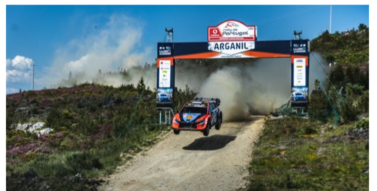
Alto voo do piloto Ott Tänak com o seu Hyundai