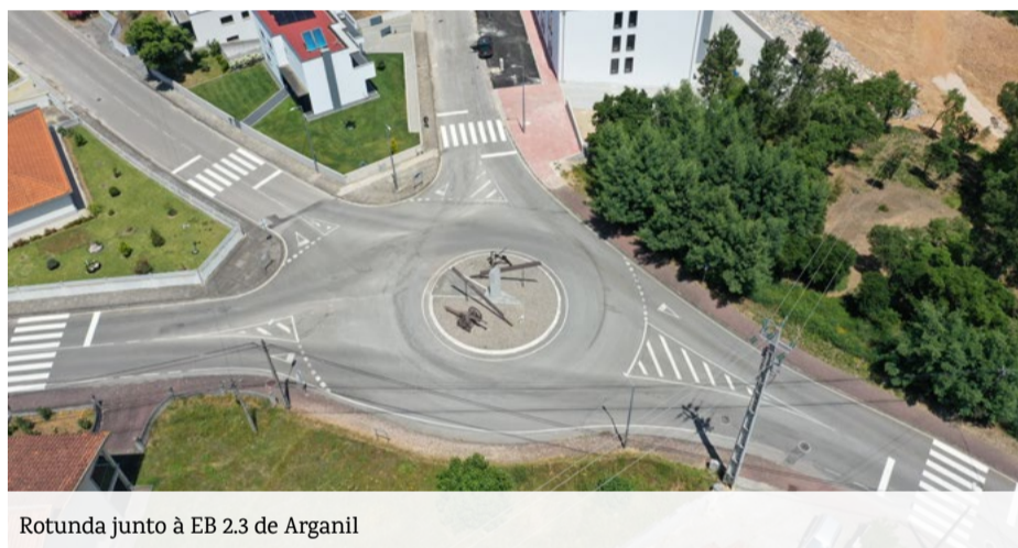
Rotunda junto à EB 2.3 de Arganil

Estas ações visam aumentar a segurança rodoviária e dos peões, contribuindo para a prevenção de acidentes e a melhoria da qualidade de vida da população.