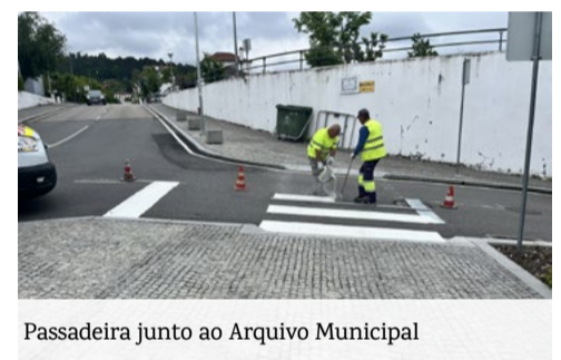
Passadeira junto ao Arquivo Municipal