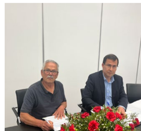
Freguesia de Secarias