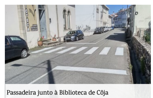
Passadeira junto à Biblioteca de Côja