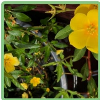
Ludwigia grandiflora na forma aquática