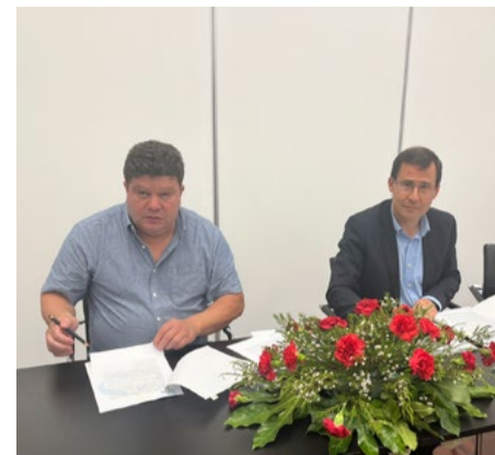
Freguesia de Benfeita