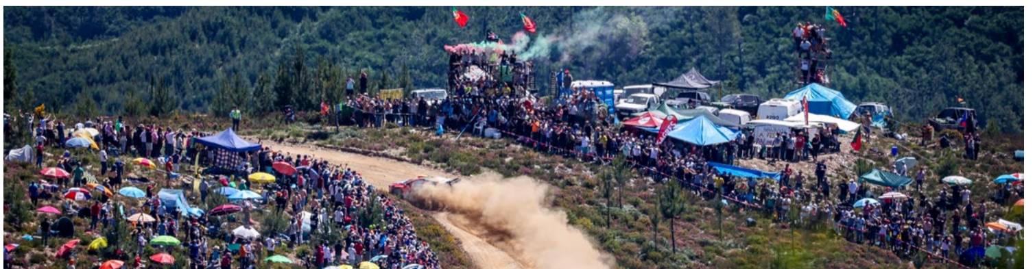
Os aficionados do rally vibraram à passagem das estrelas do WRC e das suas potentes máquinas