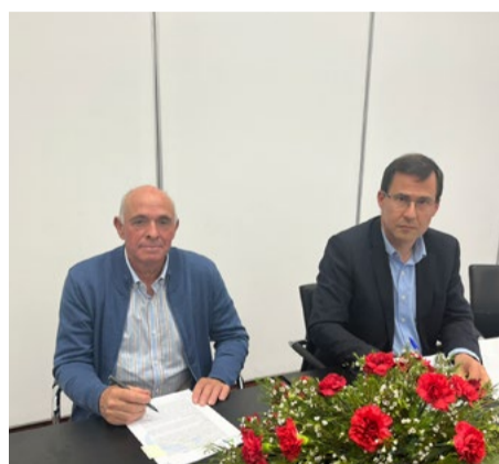
União das Freguesias de Cerdeira e Moura da Serra