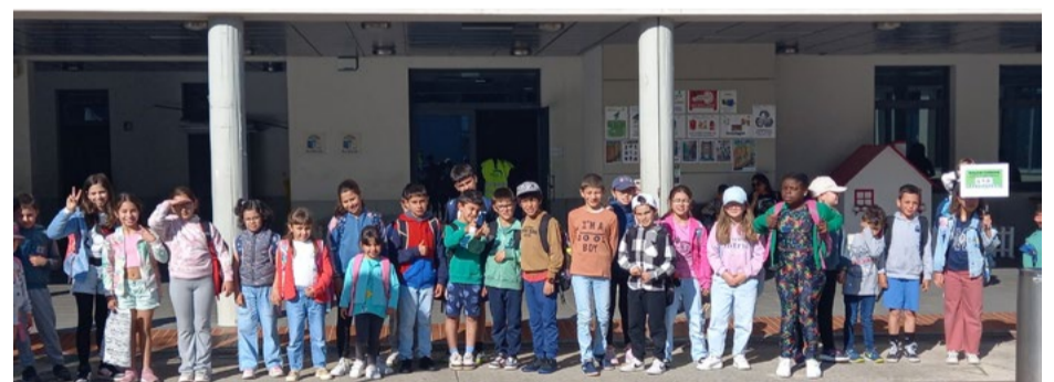
Alunos da EB1 de Arganil que participaram na atividade