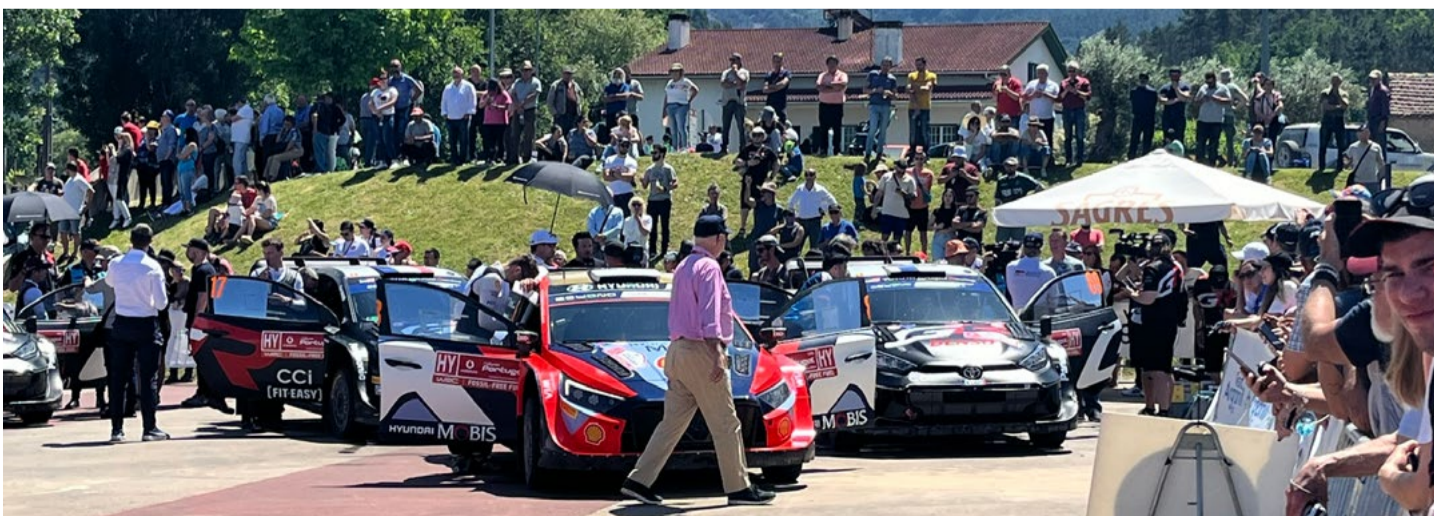
Foram muitos os curiosos e entusiastas do rally que passaram pelo Parque de Assistência, instalado no Sub-Paço, em Arganil