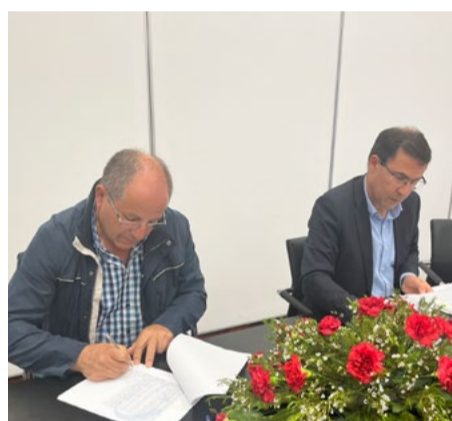
Freguesia de Folques