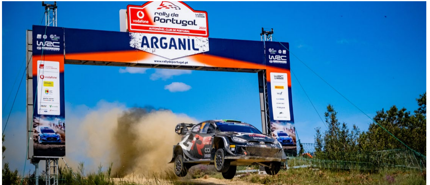
Sébastien Ogier ganhou asas no famoso salto de Arganil

Depois da classificativa da manhã, que teve passagem por Mortágua, Lousã, Góis e Arganil, os pilotos puderam meter os pés em terra firme no Parque Verde do Sub-Paço, no centro da vila de Arganil, onde esteve instalado o Parque de Assistência. Sob o olhar atento e curioso de largas centenas de pessoas, pilotos e máquinas foram assistidos antes de retomarem os trabalhos nas etapas da tarde.