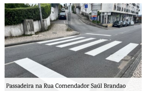
Passadeira na Rua Comendador Saúl Brandão