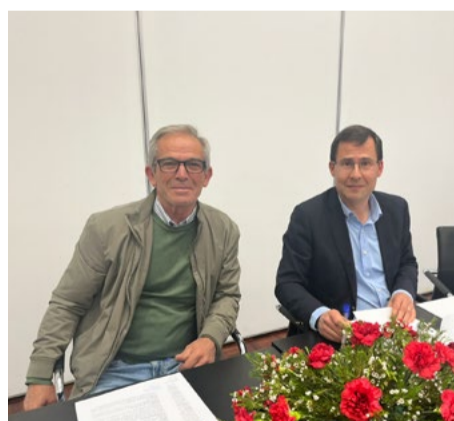
União das Freguesias de Cepos e Teixeira