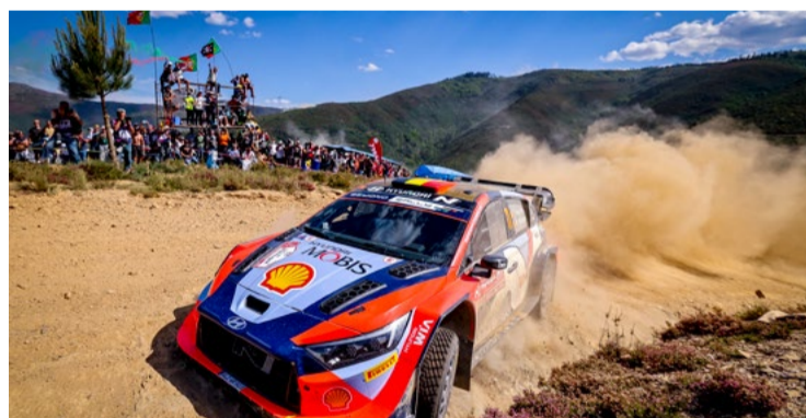
O piloto belga Thierry Neuville foi o mais rápido a completar a primeira etapa de Arganil (11:40.5)