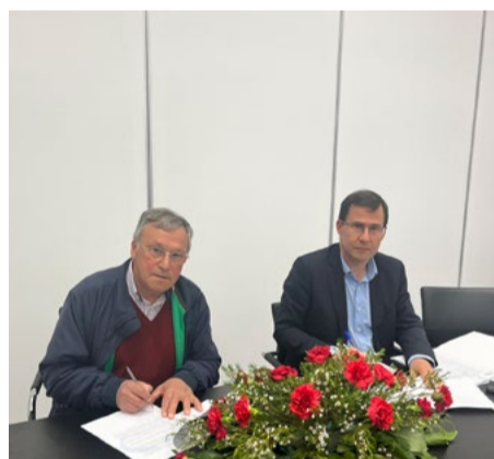
Freguesia de São Martinho da Cortiça