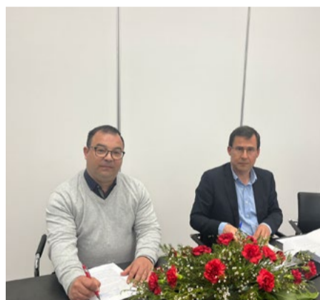
Freguesia de Sarzedo