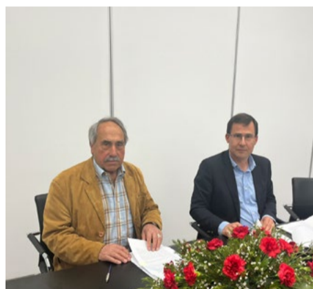
Freguesia de Pomares