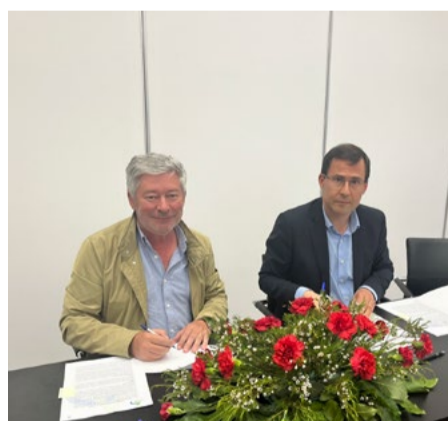
União das Freguesias de Côja e Barril de Alva