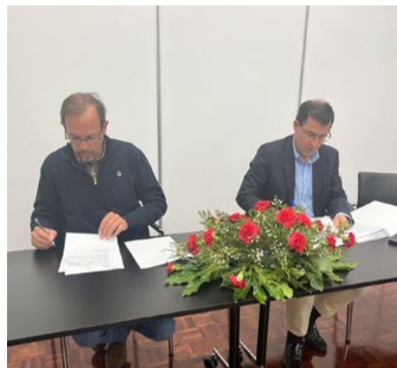
Freguesia de Arganil

As grandes obras fazem realmente sentido quando os problemas que afetam diretamente a vida das pessoas são, antes de mais, resolvidos.