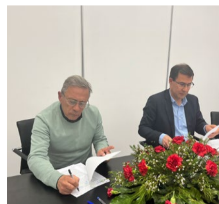
Freguesia de Pombeiro da Beira