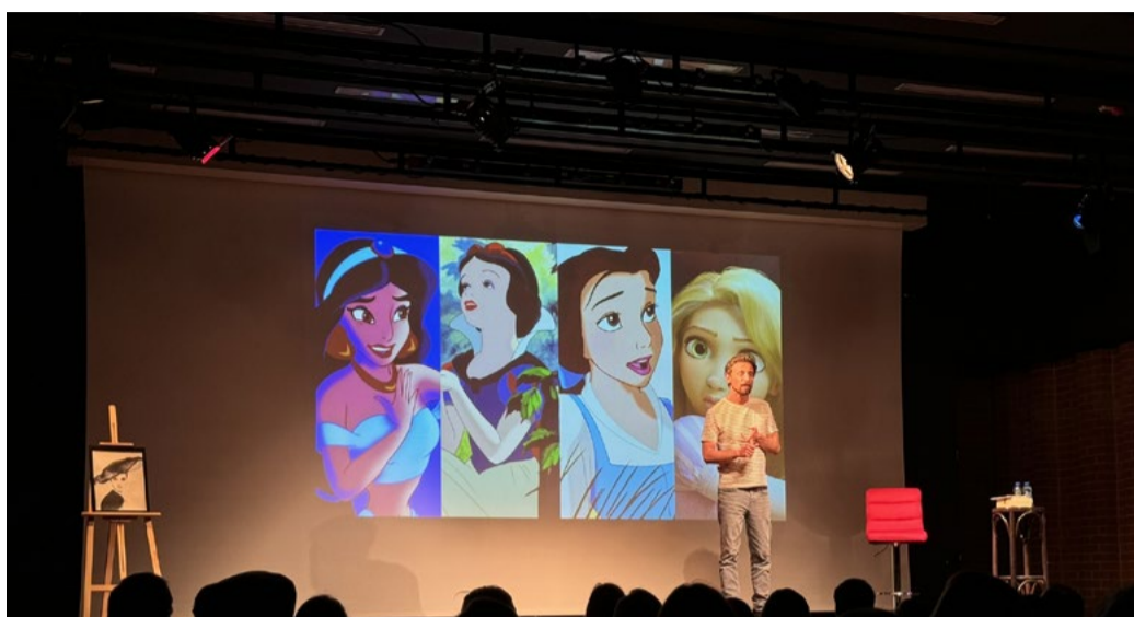
Arganil acolheu com grande entusiasmo o comediante Marco Pedrosa

e namoriscar, sobre os novos géneros, sobre as mães, passando também pelas princesas e pelas amigas, frases de engate, encontros, trocadilhos e outras trapalhadas, num espetáculo que juntou storytelling e stand up comedy, numa constante interação com o público.