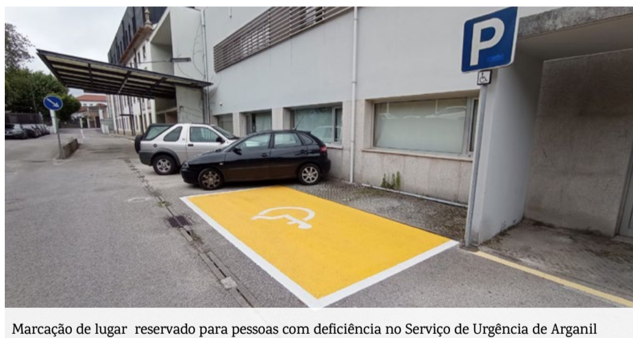
Marcação de lugar reservado para pessoas com deficiência no Serviço de Urgência de Arganil