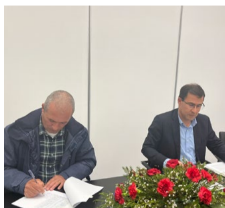
Freguesia de Celavisa