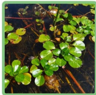
Ludwigia grandiflora na forma aquática

CASO DETETE A PRESENÇA DESTA ESPÉCIE TIRE UMA FOTOGRAFIA E CONTACTE A CÂMARA MUNICIPAL