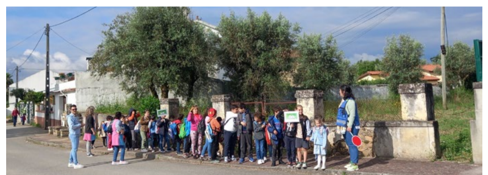
Alunos a caminho do JI/EB1 de Sarzedo